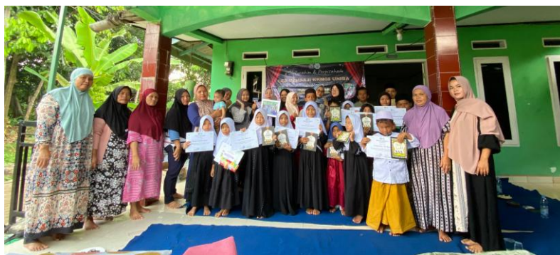
Gambar 9. Foto bersama Wali Murid Anak Les Mengaji