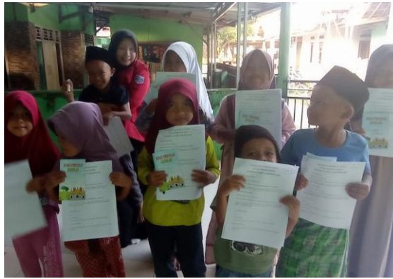
Gambar 5. Pembagian Buku Do'a Harian