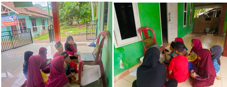
Gambar 2. Menonton Sejarah Nabi

Disamping memberikan materi pembelajaran, anak – anak Desa Tinggar melakukan suatu hiburan agar anak-anak tidak jenuh dan tidak bosan, dilakukan lah suatu program cerita dan tontonan tentang nabi dan rosul yang dilakukan setiap hari minggu sore. Tontonan serta cerita ini bukan hanya sebagai hiburan semata saja karena banyak sekali Pelajaran yang bisa diambil Dimana anak-anak nanti bisa mengetahui Sejarah nabi dan rosul karena yang mereka tonton berupa animasi sesuai dengan umur mereka. Anak-anak dikenalkan dengan kehidupan para nabi dan rasul, serta mengambil hikmah dari kisah-kisah tersebut. Dengan metode ini, mereka belajar mengenai keteladanan, kesabaran, kejujuran, dan nilai-nilai moral lainnya yang dapat diterapkan dalam kehidupan sehari-hari (Khasanah, 2022).