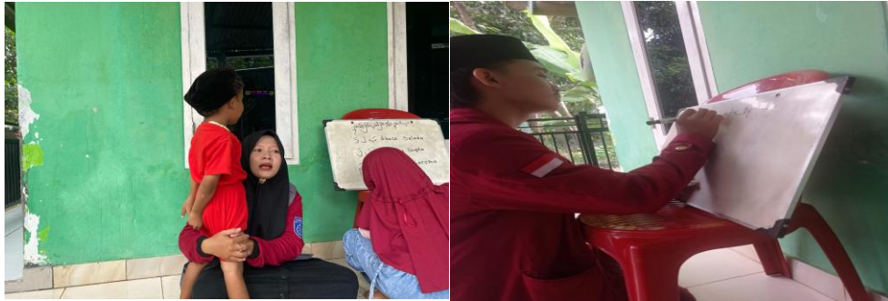
Gambar 4. Menghafal Do'a-Do'a Harian

Dalam les mengaji sore untuk anak – anak Desa Tinggar, suatu tambahan kegiatan didalam les mengaji yaitu mengajarkan do'a-do'a harian yang menjadi salah satu pembelajaran yang difokuskan untuk dihafalkan dan digunakan dalam kegiatan sehari-hari. Doa-doa tersebut bukan hanya sebagai pedoman dalam melakukan aktivitas sehari-hari, tetapi juga memiliki nilai spiritual yang penting untuk membentuk karakter dan kepribadian anak sejak usia dini" (Muhammad Arif Firdana, 2024).