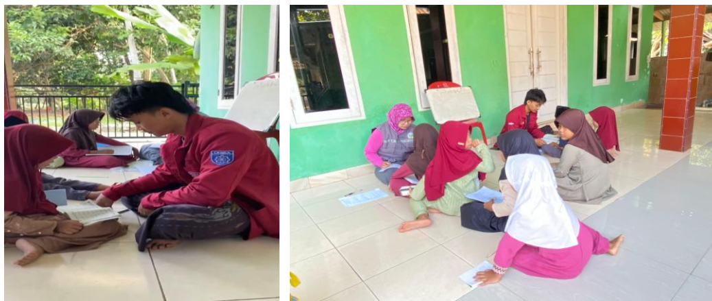
Gambar 1. Mengaji Iqro' dan Al-Qur'an