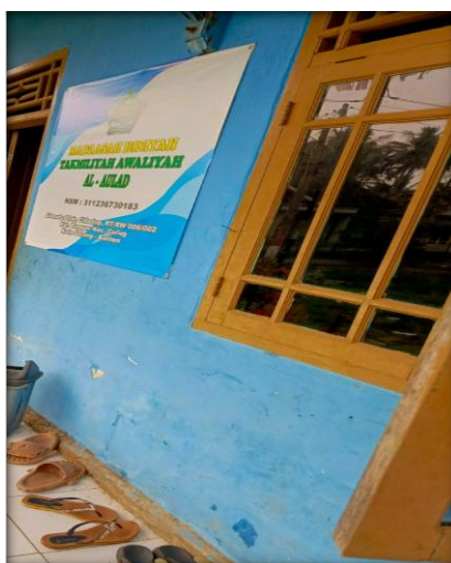
Gambar 10. Foto Identitas MDTA Al-Aulad