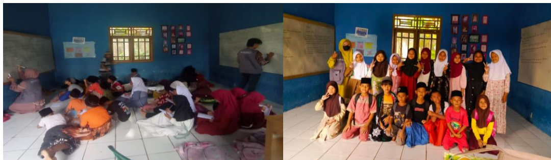
Gambar 11. Kegiatan KBM dan Foto Bersama

Penulis juga mendapatkan hasil Observasi yang dilakukan di MDTA AL-AULAD yaitu kurangnya tenaga pengajar. Hal ini kami informasikan kepada Wali Murid anak-anak yang mengikuti Les Mengaji rutin dan juga masyarakat Desa Tinggar yang rajin mengikuti kegiatan pengajian terutama di lingkungan MDTA AL-AULAD agar lebih berkontribusi serta ikut turut dalam menuangkan ilmunya untuk anak-anak yang sedang menimba ilmu agama di MDTA AL-AULAD, karena mereka sangat membutuhkan seorang guru agar pembelajaran menjadi lebih kondusif.