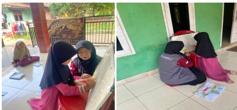
Gambar 3. Belajar Menulis Huruf Arab

Sangat penting untuk anak – anak belajar menulis serta belajar kosa kata Bahasa arab, sebagai ilmu dasar untuk membaca Al – Qur'an karena pada era modernisasi ini banyak sekali anak – anak yang belum bisa menulis atau pun membaca Bahasa arab dikarenakan sudah terpengaruh oleh hal yang tidak baik dalam media sosial khususnya.