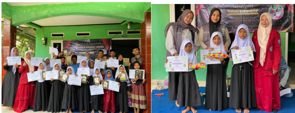
Gambar 8. Apresiasi Kepada Anak-Anak Les Mengaji