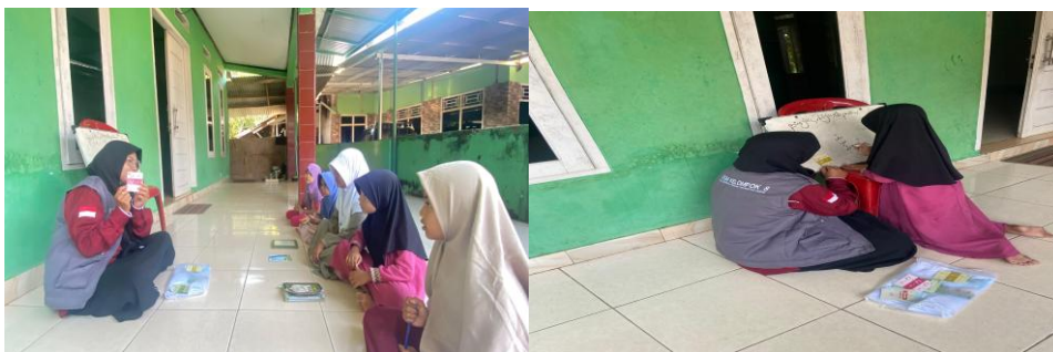
Gambar 7. Belajar Menggunakan APE

Ruth Lautfer dalam Taizaro Tafonao (2018) juga mengartikan bahwa media pembelajaran merupakan alat bantu yang digunakan guru untuk menyampaikan materi ketika mengajar sehingga meningkatkan kreativitas juga perhatian siswa. Kegiatan les mengaji yang kami lakukan merupakan kegiatan yang tidak hanya mengajarkan anak belajar mengaji Al-Qur'an saja. Namun, kegiatan ini juga memberikan materi dan bahan pembelajaran yang mengajarkan cara membaca Al-Qur'an dari dasar dan mengajari bahasa Arab dengan mudah dan menyenangkan menggunakan Media Alat Permainan Edukasi (APE) Flashcard. Selain itu, kami juga memberikan tontonan kisah-kisah nabi menggunakan alat elektronik (laptop) dengan tujuan anak-anak tidak merasa bosan dalam mempelajari sejarah islam dan nilai-nilai keagamaan. Menurut Anwar (2020), Pembelajaran agama dapat menjadi lebih menarik bagi anak dengan menggunakan berbagai pendekatan, seperti cerita Al-Qur'an, permainan edukatif, dan kegiatan kreatif.