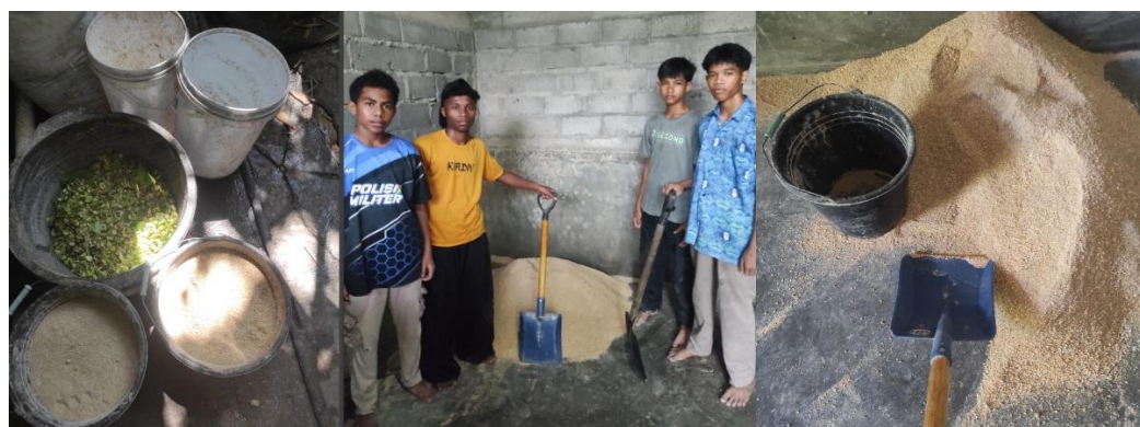
Gambar 2. Kondisi saat ini, Penyiapan pakan secara tradisional