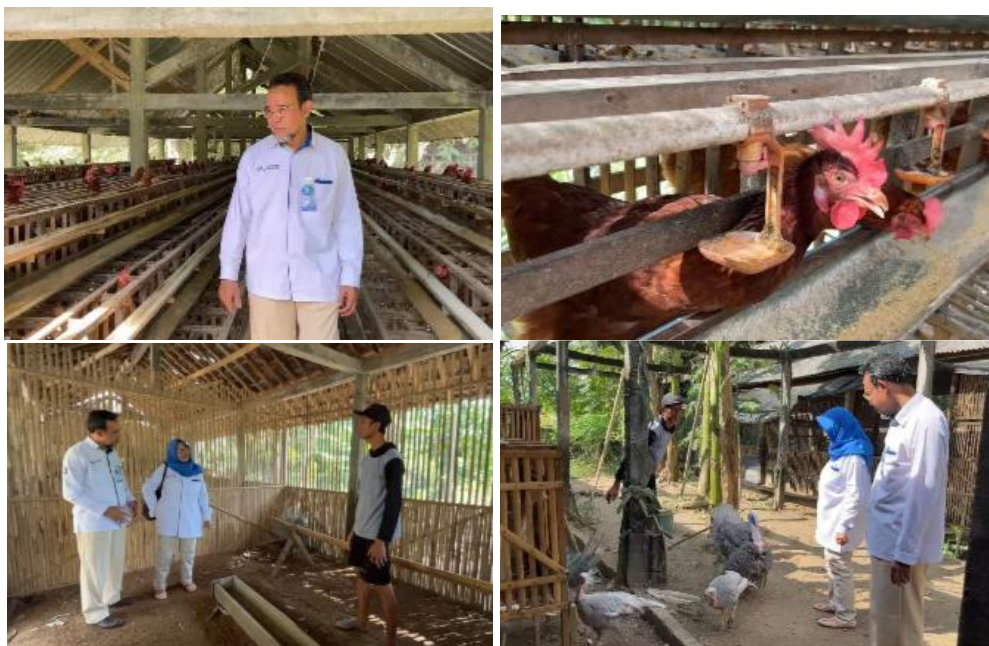
Gambar 5. Kunjungan tim pelaksana PkM ke lahan peternakan ayam dan kalkun

Setelah tim pelaksana pengabdian (PkM) melakukan sosialisasi dan penejelasan berbagai alat TTG yang akan diperbantukan, selanjutnya melakukan peninjauan langsung ke lokasi lahan peternakan ayam dan kalkun sebagai sasaran objek penerapan aplikasi TTG. Pada tahap ini, tim melakukan pengamatan secara langsung lokasi dan lahan yang akan direncanakan di pasang berbagai alat TTG tersebut. Gambar 3, menggambarkan suasana pada saat kunjungan ke lapangan.