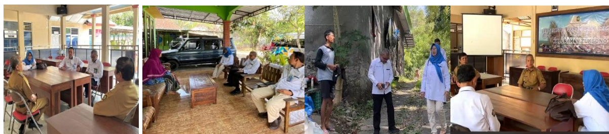
Gambar 3. Sosialisasi kepada perangkat desa dan pengelola peternakan ayam

Pelaksanaan sosialisasi program penerapan teknologi tepat guna sebagai tahap awal kegiatan diawali dengan pemaparan kepada perangkat desa Tuksono tentang rencana program pengabdian di wilayah desa dan dilanjutkan dengan sosialisasi kepada pengelola peternakan. Pada tahap ini secara rinci dijelaskan tentang berbagai peluang penerapan teknologi untuk mendukung peternakan serta berbagai keuntungan dan manfaat penerapan teknologi tepat guna sebagai pendukung kinerja usaha peternakan. Dalam sosialisasi disampaikan perbandingan antara metode pengadukan pakan manual dan menggunakan alat otomatis. Gambar 2 menunjukkan situasi sosialisasi kepada perangkat desa, dan pengelola peternakan.