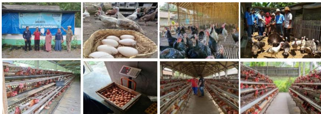
Gambar 1. Kondisi peternakan pada Kelompok Ayam Telur & Kalkun Mandiri