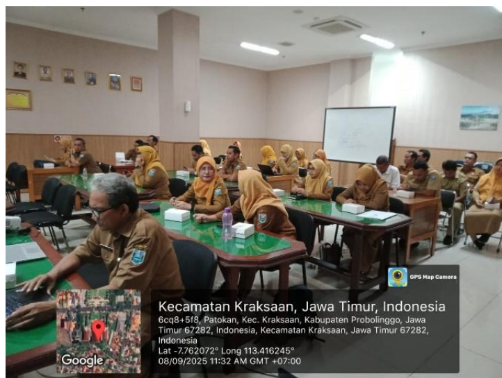
Gambar 3. Diskusi interaktif lintas instansi dalam rangka pengabdian masyarakat

Dalam forum ini, Badan Perencanaan Pembangunan, Penelitian, dan Pengembangan Daerah (BAPELITBANGDA) tampil sebagai koordinator perencanaan daerah yang menerima sekaligus mengintegrasikan informasi hasil pengabdian masyarakat ke dalam dokumen perencanaan pembangunan. Meski begitu, karena sosialisasi masih terbatas pada lingkup instansi pemerintah, peran Badan Perencanaan Pembangunan, Penelitian, dan Pengembangan Daerah (BAPELITBANGDA) lebih banyak bersifat koordinatif antarlembaga dan belum menjangkau masyarakat secara langsung.