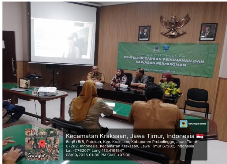
Gambar 2. Suasana rapat sosialisasi Perda sebagai bagian dari kegiatan pengabdian masyarakat

Kegiatan pengabdian masyarakat ini dilaksanakan melalui sosialisasi Peraturan Daerah (Perda) tentang penyelenggaraan perumahan dan permukiman di Kabupaten Probolinggo. Bentuk kegiatan dipilih dalam format rapat, karena forum tatap muka dianggap mampu menghadirkan suasana santai namun tetap fokus. Dengan cara ini, para peserta—yang terdiri dari melalui Badan Perencanaan Pembangunan, Penelitian, dan Pengembangan Daerah (BAPELITBANGDA), Dewan Perwakilan Rakyat Daerah DPRD, Dinas Perkim, dan Dinas PUPR—dapat lebih leluasa menyampaikan pandangan, berbagi pengalaman, sekaligus menyamakan persepsi tentang implementasi Perda di lapangan.