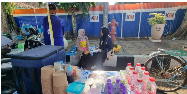
Gambar 1. survei dan wawancara

Gambar 1. memperlihatkan kegiatan survei dan wawancara yang dilakukan bersama pelaku UMKM. Kegiatan ini merupakan langkah awal dalam menggali informasi mengenai kebutuhan penggunaan QRIS serta hambatan yang mereka temui dalam transaksi digital. Temuan dari survei dan wawancara ini menjadi dasar penting dalam penyusunan materi pelatihan dan strategi pendampingan yang sesuai dengan kondisi lapangan, sehingga peserta dapat langsung menerapkan pengetahuan yang diperoleh.