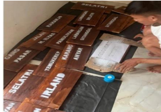
Gambar 4. Penggunaan Cat Semprot

Papan nama Kepala Desa Dan Ketua RW dibuat dengan print desain digital yang telah disiapkan sebelumnya. Desain dicetak pada kertas, dilaminating, dan ditempelkan pada papan kayu. Metode ini dipilih karena lebih mudah digunakan dan masih dapat menghasilkan papan nama yang menarik.