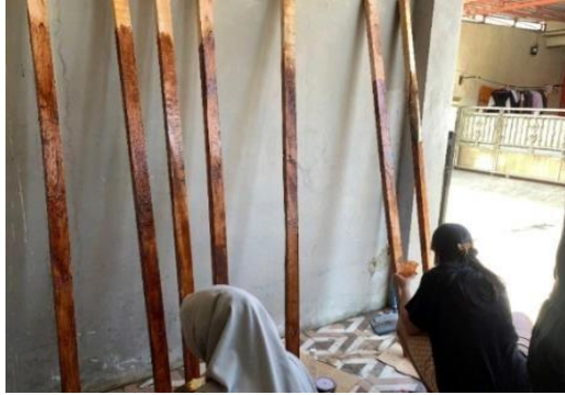
Gambar 3. Pengecatan