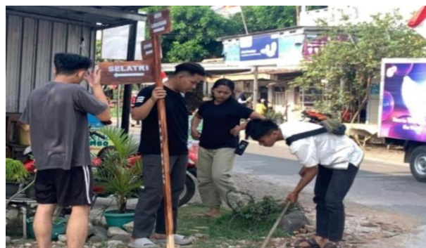
Gambar 6. Pemasangan

Setelah seluruh papan nama sudah dibuat, tahap terakhir yaitu pemasangan. Plang desa ditempatkan di tempat yang mudah dilihat seperti di dekat pintu masuk desa, Perempatan, dll. Posisinya tegak dan ketinggiannya disesuaikan agar tulisannya dapat dibaca dari ketenangan. Sementara papan nama kepala desa dan ketua RW dipasang di depan rumah masing-masing yang berfungsi sebagai penanda identitas dan membantu warga sekitar mengenali Lokasi kediaman.