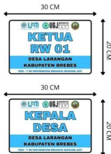
Gambar 2. Desain Papan Nama