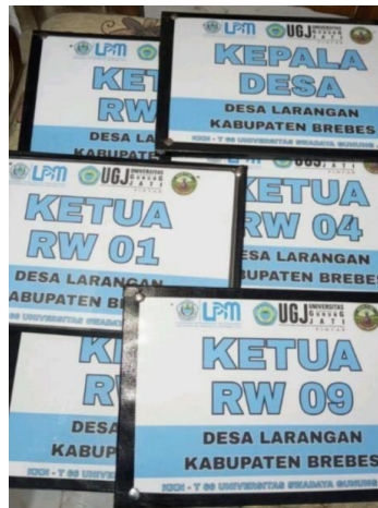
Gambar 5. Papan Nama Kepala Desa dan Ketua RW

Papan nama Kepala Desa Dan Ketua RW dibuat dengan print desain digital yang telah disiapkan sebelumnya. Desain dicetak pada kertas, dilaminating, dan ditempelkan pada papan kayu. Metode ini dipilih karena lebih mudah digunakan dan masih dapat menghasilkan papan nama yang menarik.