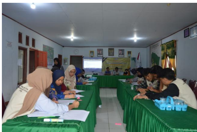
Gambar 4. Pelatihan Manajemen Keuangan Usaha

pemahaman mengenai konsep dasar manajemen keuangan usaha, perhitungan Harga Pokok Penjualan (HPP), serta teknik pencatatan transaksi keuangan harian dan bulanan. Materi disampaikan secara interaktif dengan mengaitkan contoh nyata dari aktivitas usaha peserta, sehingga memudahkan mereka dalam memahami penerapan konsep keuangan sesuai dengan karakteristik usaha masing-masing.