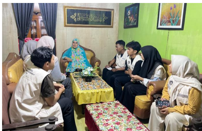
Gambar 1. Wawancara dengan Salah Satu Pelaku Usaha

Hasil analisis kebutuhan mitra menunjukkan bahwa pelaku usaha di Desa Pao masih menghadapi sejumlah permasalahan yang berdampak pada keberlangsungan dan pengembangan usaha. Berdasarkan hasil observasi lapangan dan wawancara mendalam, diketahui bahwa sebagian besar pelaku usaha belum memiliki legalitas usaha maupun sertifikasi produk. Kondisi tersebut menjadi salah satu hambatan utama dalam memperluas akses pasar, karena ketiadaan dokumen legal seperti Nomor Induk Berusaha (NIB) dan izin PIRT dapat menurunkan tingkat kepercayaan konsumen terhadap keamanan dan kualitas produk yang dihasilkan (Ruswandi et al., 2025). Selain itu, pelaku usaha juga menghadapi tantangan pada aspek manajerial, terutama dalam hal pencatatan serta pengelolaan keuangan. Kurangnya pemahaman terkait sistem keuangan usaha menyebabkan tidak adanya pemisahan antara keuangan pribadi dan keuangan usaha, serta lemahnya kemampuan dalam melakukan evaluasi kinerja keuangan secara objektif (Jedeot et al., 2025).