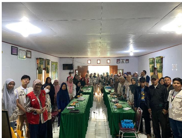
Gambar 2. Pelatihan Legalitas Usaha dan Sertifikasi Produk

diskusi dan tanya jawab untuk memberikan kesempatan kepada peserta mengklarifikasi kendala yang dihadapi serta memperdalam pemahaman terhadap materi yang telah disampaikan.