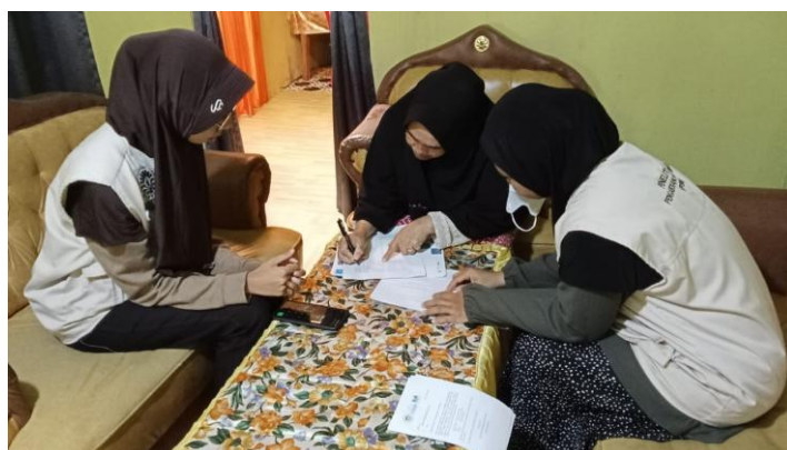
Gambar 6. Monitoring dan Evaluasi Pasca Pelatihan

evaluasi dilakukan melalui observasi selama kegiatan berlangsung, wawancara, formulir feedback , serta analisis hasil pre test dan post test dari kedua pelatihan yang dilaksanakan. Berdasarkan hasil monitoring dan evaluasi, diketahui bahwa tingkat partisipasi dan antusiasme peserta tergolong tinggi, ditunjukkan dengan kehadiran yang konsisten serta keterlibatan aktif dalam sesi diskusi dan praktik. Peserta menunjukkan peningkatan pemahaman yang signifikan terhadap materi pelatihan, baik pada aspek legalitas usaha dan sertifikasi produk maupun manajemen keuangan, yang tercermin dari hasil evaluasi kuantitatif serta umpan balik positif yang diberikan. Selain itu, pendekatan partisipatif yang diterapkan terbukti efektif dalam menciptakan suasana pembelajaran yang interaktif dan mendorong peserta untuk lebih terbuka dalam menyampaikan pengalaman serta kendala yang mereka hadapi.