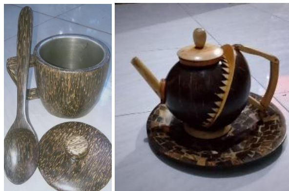
Gambar 2. Contoh salah satu produk unggulan