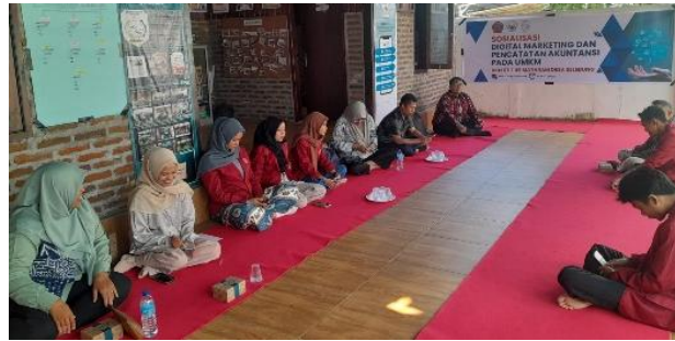
Gambar 1. Pemaparan Materi Dan Diskusi

Secara keseluruhan, kegiatan ini berhasil menjawab permasalahan mitra terkait keterbatasan kemampuan pemasaran digital dan kurangnya identitas produk lokal. Implementasi hasil pengabdian ini memberikan dampak nyata terhadap peningkatan kapasitas pelaku UMKM dalam mengelola usaha berbasis teknologi, sekaligus memperkuat posisi Desa Selebung sebagai desa kreatif yang berdaya saing di era ekonomi digital.