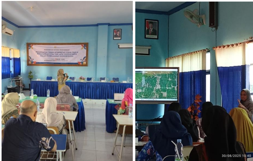
Gambar 4. Tim memberikan workshop pelatihan time lapse google earth

Kegiatan yang diikuti oleh 60 guru Geografi se-Kabupaten Nganjuk ini berlangsung di SMA Negeri 2 Nganjuk dengan antusiasme yang sangat tinggi. Tim dosen Pendidikan Geografi telah melakukan persiapan yang matang untuk memastikan keberlangsungan acara berjalan lancar. Rangkaian kegiatan dimulai dengan acara pembukaan yang dilanjutkan dengan penandatanganan perjanjian kerja sama antara tim pelaksana dan MGMP Geografi Kabupaten Nganjuk. Setelah itu, di ikuti oleh kegiatan inti berupa pelatihan pemanfaatan Google Earth Time-Lapse dan teknologi berbasis AI dalam pembelajaran geomorfologi.