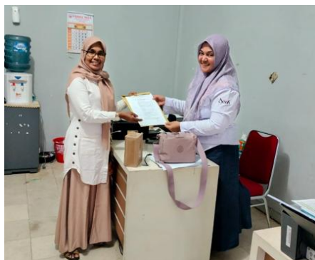
Gambar 3. Pengajuan dan penyerahan berkas ke Dinas Pariwisata