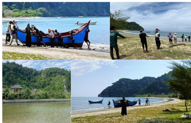
Gambar 1. Potensi Objek Ekowisata Gampong Paroy

Teridentifikasi berbagai potensi objek wisata di Gampong Paroy, diantaranya keanekaragaman hayati hutan tropis dengan berbagai flora dan fauna liar, lanskap perbukitan/pegunungan dengan pemandangan yang menarik, pantai berpasir putih yang langsung berbatasan dengan bukit, laut dengan terumbu karang serta tradisi budaya tarik pukot (Gambar 1) dan kuliner lokal. Selain itu, masyarakat Paroy masih memiliki semangat gotong royong dan masih mempertahankan kearifan lokal yang kuat sebagai modal pendukung ekowisata potensial. Kearifan lokal merupakan cerminan pandangan hidup masyarakat tradisional yang mengandung nilai-nilai moral dan etika mengenai hubungan manusia dengan alam yang dapat menumbuhkan perilaku ramah lingkungan sehingga berguna untuk konservasi lingkungan (Irhas, & Ofan Satria. 2025; Arifah, K. A., & Saputra, M. 2023).