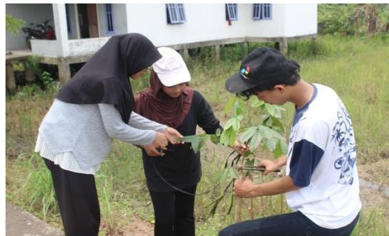
Gambar 7. Pemasangan Bambu