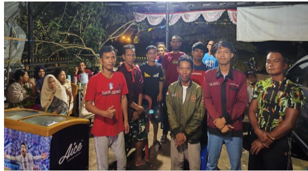
Gambar 11. Pembentukan Kelompok Masyarakat Sadar Lingkungan (KMSL)