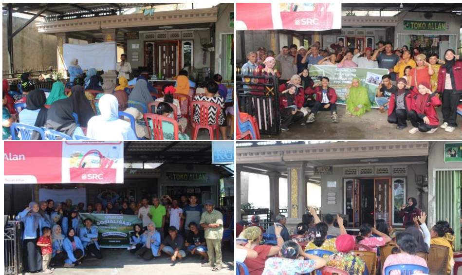
Gambar 5. Sosialisasi Umum, Pelatihan Teknis, serta Diskusi Terbuka Dengan Masyarakat

Setelah tahap perencanaan selesai, kegiatan dilanjutkan dengan sosialisasi dan pelatihan masyarakat untuk memperkenalkan tujuan program sekaligus memberikan edukasi tentang pentingnya menjaga lingkungan. Tahap ini menekankan metode edukatif melalui pelatihan teknis, penyuluhan, dan diskusi, serta metode partisipatif melalui keterlibatan warga dalam memberikan masukan berdasarkan pengalaman lokal. Pendekatan edukatif dalam pengabdian masyarakat berperan penting dalam membangun perilaku hijau dan kesadaran keberlanjutan di tingkat lokal (Kurniawan et al., 2022). Beberapa kegiatan yang dilakukan antara lain: