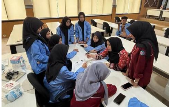
Gambar 4. Koordinasi dengan Dosen Pembimbing mengenai penyusunan rencana kerja