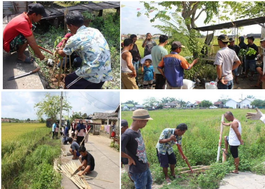
Gambar 6. Kegiatan Penanaman Bersama Warga