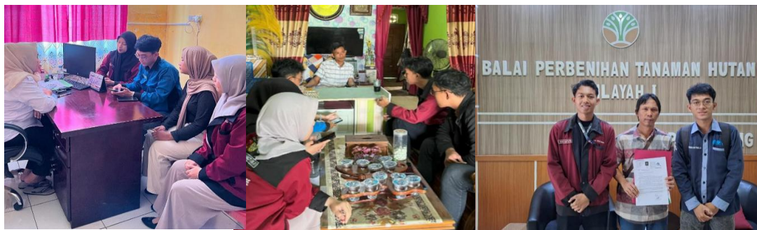
Gambar 2. Koordinasi dan Perizinan Kegiatan Bersama Lurah Keramasan, Ketua RT 29 dan Pihak BPTH