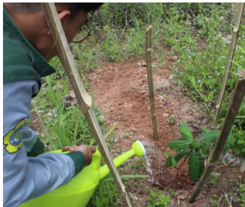
Gambar 9. Penyiraman Bibit Tanaman