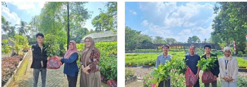
Gambar 3. Penerimaan Bantuan Bibit Tanaman dari BPTH Wilayah 1 Provinsi Sumatera Selatan