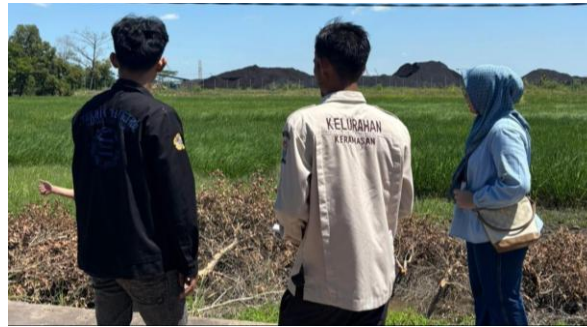
Gambar 1. Survei Lapangan Awal

Tahap awal dimulai dengan melakukan serangkaian kegiatan observasi dan analisis kebutuhan masyarakat. Proses ini dilakukan di wilayah RT.29 Jl. Sungai Tengkorak, Kelurahan Keramasan, Kecamatan Kertapati, Kota Palembang, yang menjadi lokasi utama pelaksanaan program. Kegiatan pada tahap ini meliputi: