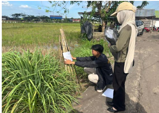
Gambar 8. Pemasangan Label Tanaman