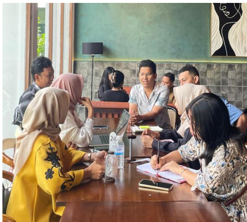
Gambar 1. Penyampaian materi pentingnya perpajakan bagi UMKM dan Sesi tanya Jawab

enggannya mencari tahu lebih jauh. Sehingga, pemilik usaha menyerahkan perhitungan dan pelaporan pajaknya kepada konsultan pajak. Lebih dari itu, ia juga tidak pernah memikirkan bagaimana pajak berperan dalam membiayai infrastruktur, pendidikan, kesehatan, maupun fasilitas umum lainnya yang ia nikmati setiap hari. Ketidaktahuan ini mencerminkan kondisi banyak pelaku UMKM di lapangan yang belum memahami peran strategis pajak dalam pembangunan negara.