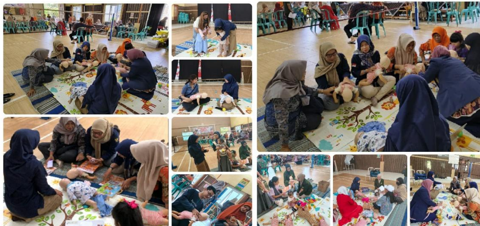
Gambar 3. Kegiatan Demonstrasi / Praktik

Meskipun pelaksanaannya tidak selalu bersamaan, seluruh peserta mendapatkan kesempatan praktik langsung dan bimbingan secara personal. Sebagai contoh, pelatihan berbasis komunitas di sekolah di Kota Padang menunjukkan bahwa meskipun peserta memiliki latar berbeda, intervensi tetap berhasil meningkatkan pengetahuan dari 53,2 % ke 69,3 % (Irwandi & Saputra Utama, 2024)