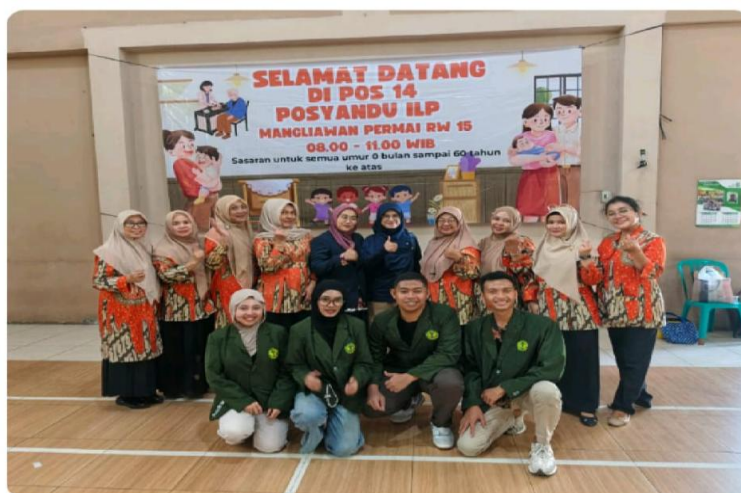
Gambar 4. Foto Bersama Tim PKM dan Kader Posyandu

Pendekatan fleksibel dan partisipatif menjadi kunci keberhasilan dalam kegiatan ini dengan berbasis komunitas. Meskipun waktu pelaksanaan terbagi menjadi beberapa sesi kecil, namun tujuan utama pelatihan yaitu meningkatkan pemahaman dan keterampilan ibu serta pengasuh dalam menangani anak tersedak tetap tercapai dengan baik.