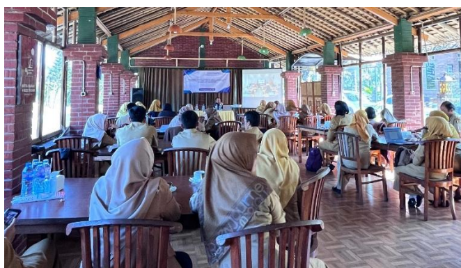
Gambar 2. Pelaksanaan Penyampaian Materi Pendidikan Keuangan

Penerapan gamifikasi dalam pendidikan keuangan menawarkan pendekatan inovatif yang mampu menjembatani kesenjangan antara teori dan praktik. Konsep keuangan sering kali dianggap abstrak dan sulit dipahami, khususnya ketika berkaitan dengan perencanaan anggaran, pengelolaan keuangan, atau pengambilan keputusan investasi (Liu et al., 2023). Konsep gamifikasi dapat diterjemahkan ke dalam pengalaman belajar yang konkret melalui permainan interaktif. Misalnya, peserta dapat diberikan simulasi mengelola anggaran rumah tangga, memilih instrumen investasi dengan risiko berbeda, atau menghadapi tantangan keuangan yang harus diselesaikan dalam batas