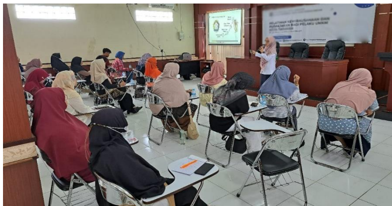
Gambar 2. Kegiatan Pelatihan

Pada aspek pengelolaan arus kas, peserta mulai memahami pentingnya menjaga keseimbangan antara pemasukan dan pengeluaran. Mereka juga mampu mengidentifikasi komponen arus kas dan menyusunnya secara sederhana, yang menunjukkan peningkatan dalam pengelolaan keuangan jangka pendek.