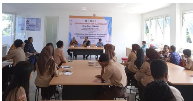
Gambar 2. Pengantar pelatihan dasar-dasar otomatisasi berbasis Arduino

Gambar 2 dan Gambar 3 merupakan foto-foto saat acara pelatihan dasar-dasar otomatisasi berbasis Arduino pada siswa Fase E kelas X di SMAN Tawangmangu Karanganyar.