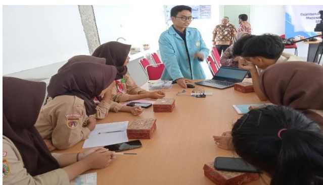
Gambar 3. Pelatihan dasar-dasar otomatisasi berbasis Arduino murid Kelas X