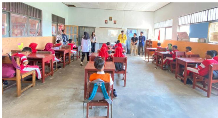
Gambar 1. Perkenalan dan persiapan Pre-Test sebelum Treatment