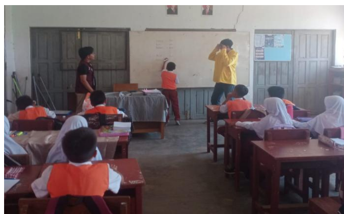
Gambar 4. Siswa maju menuliskan hasil kosakata di kelas