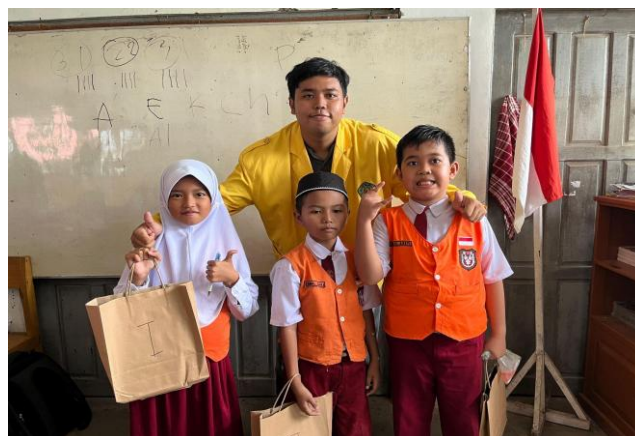
Gambar 7. Pembagian Hadiah diwakilkan ketua kelompok