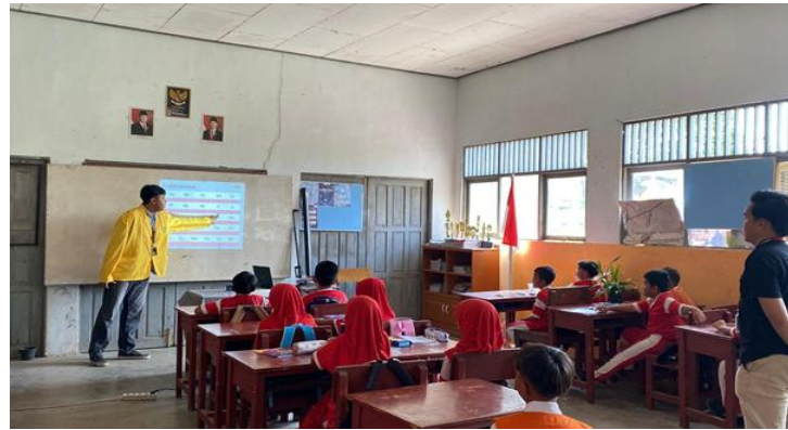
Gambar 2. Treatment Pertama pengenalan abjad bahasa Inggris

Pada pertemuan pertama, kegiatan difokuskan pada observasi awal dan pelaksanaan pre-test pengejaan kata benda dalam bahasa Inggris. Observasi dan pre-test ini bertujuan untuk mengetahui tingkat pemahaman siswa terhadap penguasaan alfabet dan kosakata bahasa Inggris. Berdasarkan hasil observasi dan pre-test, tim PKM menemukan bahwa sebagian besar siswa belum menguasai alfabet dalam bahasa Inggris. Oleh karena itu, setelah pelaksanaan pre-test, tim PKM memulai proses pengajaran dengan memperkenalkan alfabet terlebih dahulu. Tujuannya adalah agar siswa dapat memahami dan menguasai alfabet bahasa Inggris sebelum memasuki tahap pembelajaran selanjutnya.