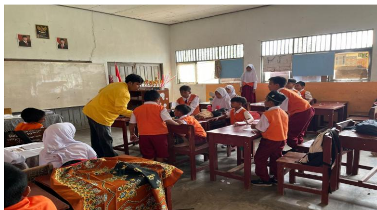
Gambar 6. Pelaksanaan permainan spelling bee