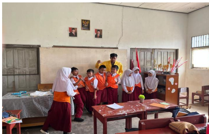
Gambar 5. Pemilihan ketua serta anggota untuk Permainan Spelling Bee