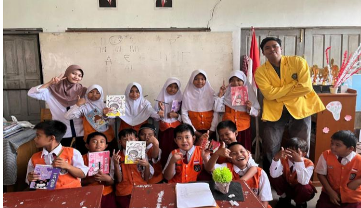
Gambar 8. Foto bersama tim PKM, guru dan siswa

Pada pertemuan ketiga, siswa dianggap sudah siap setelah melalui tahap persiapan pada pertemuan pertama dan kedua untuk memulai permainan Spelling Bee. Siswa dibagi menjadi tiga tim, masing-masing terdiri atas empat hingga lima orang.