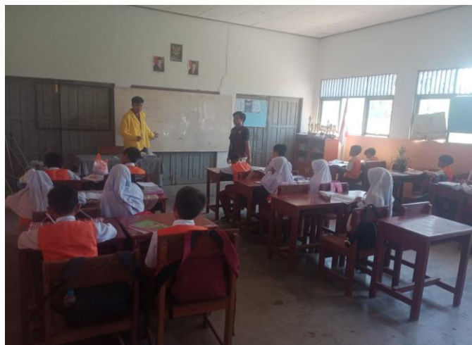
Gambar 3. Treatment kedua pengenalan vocabulary benda dikelas