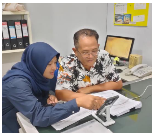
Gambar 3. Kegiatan Pendampingan Pemindaian Kode QR

Tahap evaluasi merupakan kegiatan pendampingan terakhir yang dilaksanakan pada Senin, 27 Oktober 2025. Pada tahap ini, tim pendamping bersama staff pajak melakukan serangkaian kegiatan untuk meninjau hasil penerapan sistem pengarsipan berbasis abjad dan digitalisasi dokumen yang telah dilaksanakan. Proses evaluasi diawali dengan pemeriksaan ulang terhadap hasil penataan arsip, baik dalam bentuk fisik maupun digital, untuk memastikan seluruh dokumen telah tersusun sesuai urutan abjad dan tersimpan dalam folder digital dengan benar.