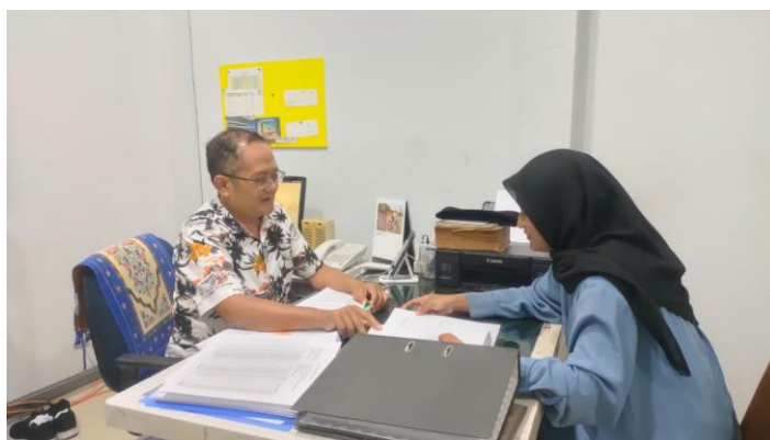
Gambar 1. Pendampingan Identifikasi Permasalahan pada Pengelolaan Arsip Lama

Tahap identifikasi masalah dilaksanakan pada hari Rabu, 15 Oktober 2025, sebagai langkah awal dalam kegiatan pendampingan. Pada tahap ini, tim pengabdian masyarakat melakukan analisis langsung terhadap sistem pengarsipan faktur pajak yang telah diterapkan di PT Graha Damai Putra. Proses ini meliputi pengamatan cara penyimpanan dokumen dan proses pencarian dokumen yang dilakukan oleh staff pajak. Selain itu, tim juga melakukan wawancara untuk mengetahui hambatan yang sering muncul, seperti penataan dokumen yang tidak berurutan, waktu pencarian arsip yang lama, dan belum adanya sistem penyimpanan digital.