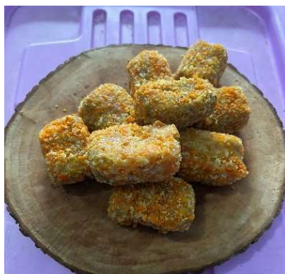
Gambar 4. Hasil Pembuatan Nugget dari Ikan Lele