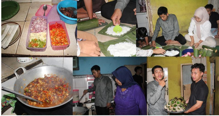
Gambar 5. Proses pengolahan bekamal yang sudah selesai difermentasi

Beberapa makanan yang menjadi hasil olahan untuk Culinary Walking Tour adalah bekamal yang dimasak menjadi sego Jajang dan ditambahkan tempe lanang sebagai kudapan untuk peserta. Hasil dari simulasi ini menunjukkan bahwa model Culinary Walking Tour mampu menciptakan suasana wisata yang edukatif, interaktif, dan memperkuat identitas lokal desa wisata Gintangan. Wisatawan merasa lebih terlibat secara emosional dan memperoleh pengalaman autentik dari interaksi langsung dengan pengrajin.