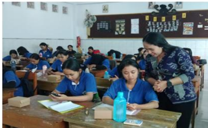
Gambar 4. Pendampingan oleh Fasilitator pada Sesi Workshop

Peserta diperkenalkan pada beberapa perangkat lunak desain berbasis digital yang user friendly seperti Canva , Piktochart , dan Infogram . Aplikasi ini dipilih karena aksesibilitasnya yang tinggi serta kemudahan penggunaannya (Sugiarni., Widiastuti, D., & T.,2024) sehingga sesuai untuk kalangan pendidikan menengah (Agustini, S. 2023; Jamaludin, N., & Sedek, S.2024). Dalam sesi ini, fasilitator menyampaikan tiga komponen utama dalam penyusunan infografis ilmiah seperti prinsip dasar desain visual, teknik memilih dan mengolah data, penyusunan narasi visual. Pelatihan dilaksanakan secara praktik langsung dengan pendampingan aktif dari fasilitator.