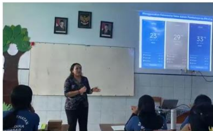
Gambar 3. Fasilitator Menyajikan Contoh Kasus Nyata yang Bersumber Dari Data Lokal Maupun Referensi Ilmiah

Setelah peserta memahami urgensi literasi sains melalui kegiatan sosialisasi, tahapan berikutnya adalah pemaparan materi inti yang disampaikan secara sistematis dan aplikatif. Materi ini dirancang untuk memperkuat pemahaman konseptual peserta mengenai literasi sains, sekaligus menunjukkan relevansinya dalam kehidupan sehari-hari, terutama dalam konteks kesehatan lingkungan. Pemaparan diawali dengan penjelasan mengenai pengertian literasi sains yang mencakup kemampuan memahami konsep-konsep ilmiah, mengevaluasi informasi berbasis data, serta mengomunikasikan temuan atau hasil analisis secara efektif. Konsep ini dikaitkan langsung dengan isu-isu kesehatan lingkungan yang relevan di sekitar sekolah, seperti penanganan limbah medis, sanitasi air bersih, serta paparan polusi udara dari aktivitas transportasi. Untuk memperkuat keterkaitan antara teori dan praktik, fasilitator menyajikan contoh kasus nyata yang bersumber dari data lokal maupun referensi ilmiah (Gambar 3).