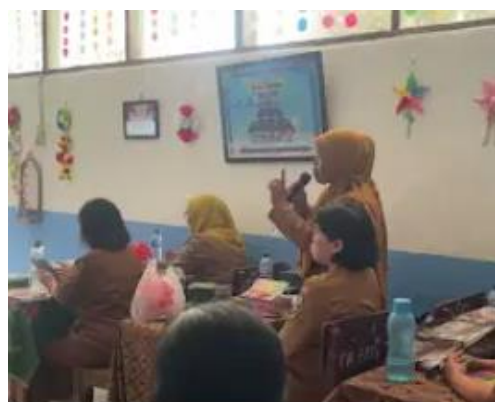
Gambar 9. Diskusi