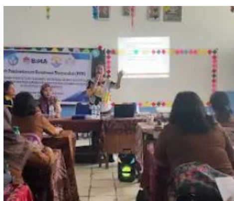
Gambar 8. Pemaparan Materi