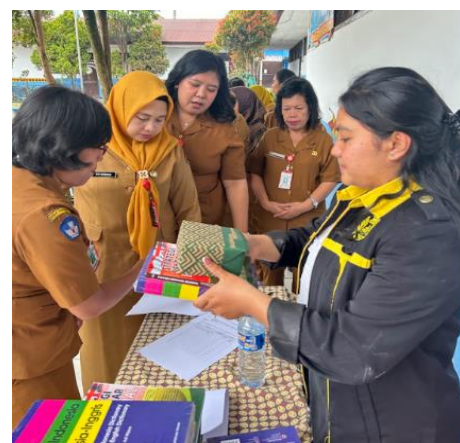
Gambar 14. Ucapan Terimakasih dari Kepala Sekolah SD Negeri 040459 Berastagi