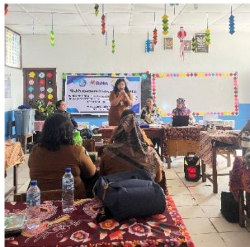
Gambar 7. Kata Sambutan Oleh Ketua Komunitas Belajar