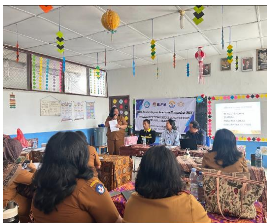
Gambar 13. Pembagian Konsumsi dan Transportasi