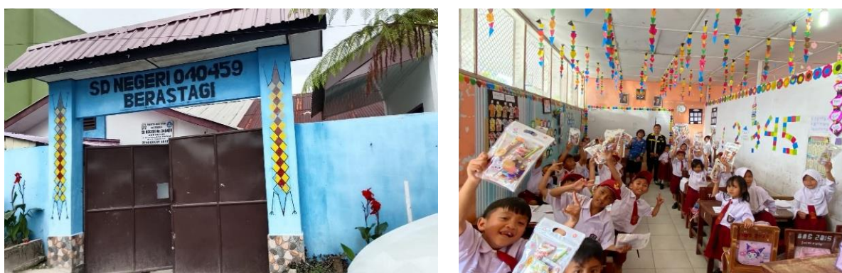
Gambar 2. Kondisi SD Negeri 040459 Berastagi

Berikut kita dapat melihat kondisi SD Negeri 040459 Berastagi seperti dibawah ini: