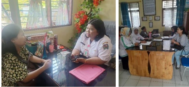
Gambar 3. Koordinasi dengan Kepala Sekolah dan Mitra Komunitas Belajar mengenai rencana program sosialisasi pembelajaran bilingual

Koordinasi awal menunjukkan antusiasme tinggi dari pihak sekolah karena kegiatan ini sejalan dengan program peningkatan mutu pendidikan dan penguatan karakter siswa.