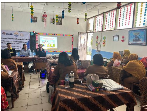
Gambar 12. Pemaparan Materi Pendidikan Karakter