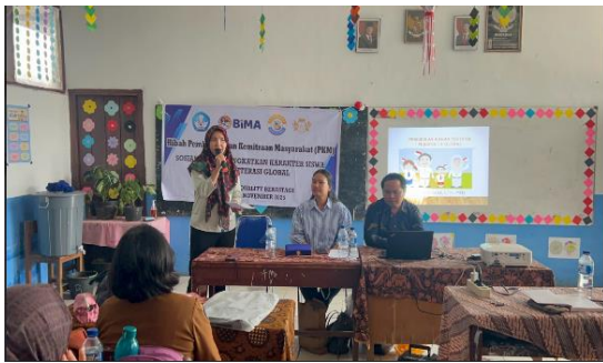
Gambar 10. Kata Pembuka Oleh MC

dalam Literasi Global. Hasil pelatihan ini menunjukkan bahwa anggota Komunitas belajar mulai memahami pentingnya Pendidikan karakter siswa dalam menghadapi literasi global.