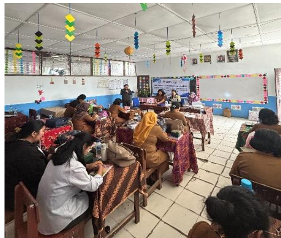
Gambar 5. Doa Pembuka