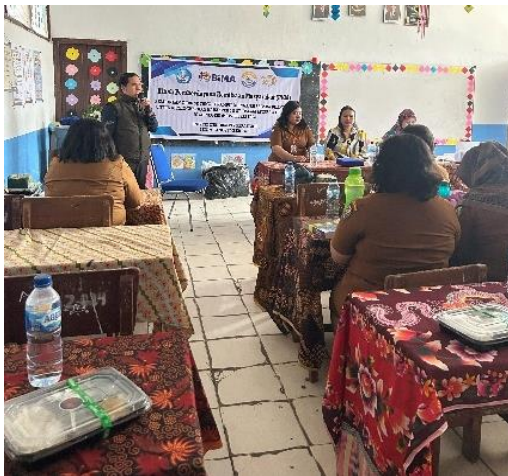
Gambar 4. Kata Pembuka Oleh Pembawa Acara (MC)

Sebanyak 17 guru mengikuti pelatihan dengan tingkat partisipasi yang sangat baik. Para guru terlibat aktif dalam sesi diskusi, praktik berbicara Bahasa Inggris sederhana, serta simulasi kegiatan belajar mengajar bilingual di kelas.