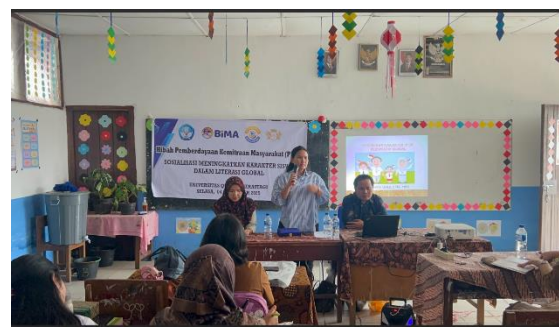
Gambar 11. Kata Sambutan oleh Ketua Tim