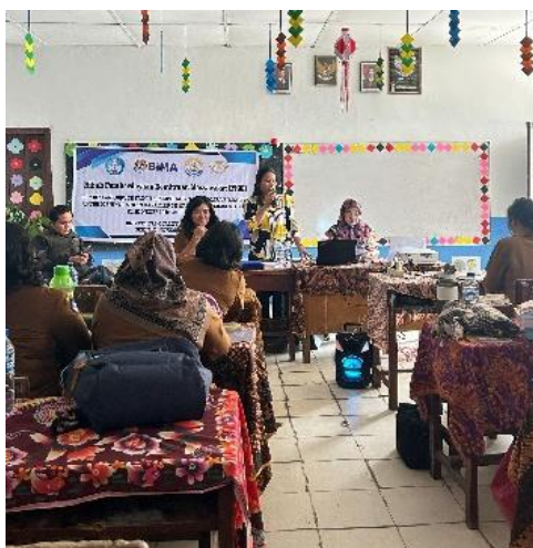
Gambar 4. Kata Sambutan oleh Ketua Tim Pengabdian