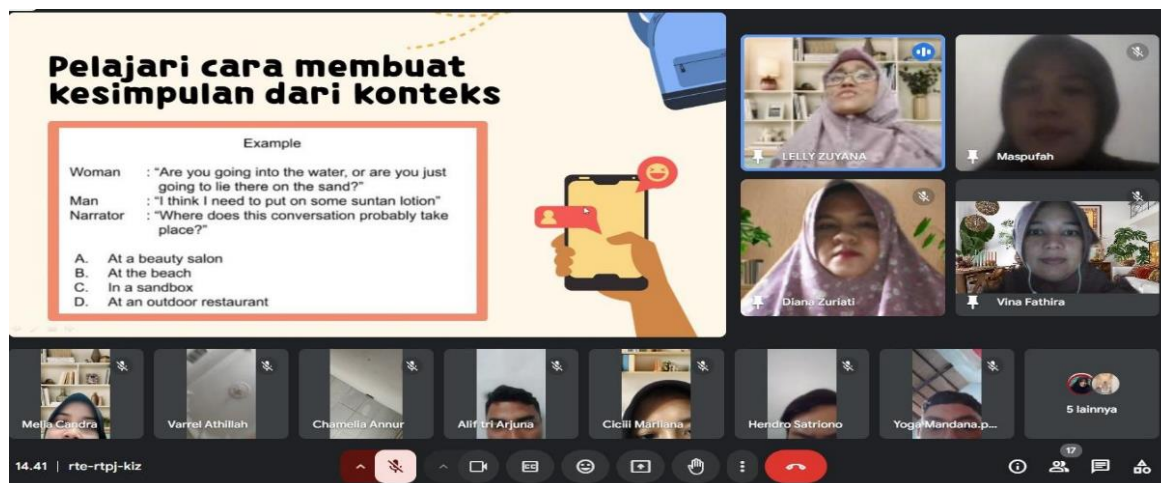
Gambar 4. Mahasiswa mempraktikkan soal TOEFL Listening : Pelajari cara membuat kesimpulan berdasarkan konteks percakapan

Strategi belajar secara aktif dan kolaboratif ini sesuai dengan temuan penelitian yang menunjukkan bahwa pendekatan berbasis tugas dan diskusi kelompok dapat meningkatkan kemampuan mahasiswa dalam menangkap informasi dari audio serta meningkatkan skor TOEFL Listening (Juliana, 2021; Silfani et al., 2023). Mahasiswa juga didorong untuk berdiskusi secara kelompok daring, berbagi strategi menjawab, dan saling mengevaluasi jawaban, sehingga proses pembelajaran menjadi lebih interaktif dan kolaboratif.