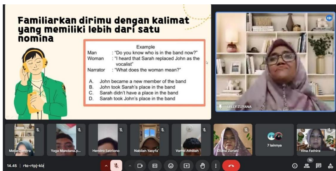
Gambar 5. Mahasiswa mempraktikkan soal TOEFL Listening : Familiarikan diri dengan kalimat yang memiliki lebih dari satu nomina

Pada Gambar 4, terlihat peserta sedang diarahkan untuk menangkap informasi penting dari setiap bagian percakapan dan menyusun pemahaman yang tepat sebelum memilih jawaban. Narasumber mendampingi secara daring, memberikan arahan dan klarifikasi saat mahasiswa menghadapi kesulitan, sehingga praktik ini tidak hanya melatih kemampuan mendengar, tetapi juga keterampilan analisis dan penalaran dalam konteks TOEFL Listening .