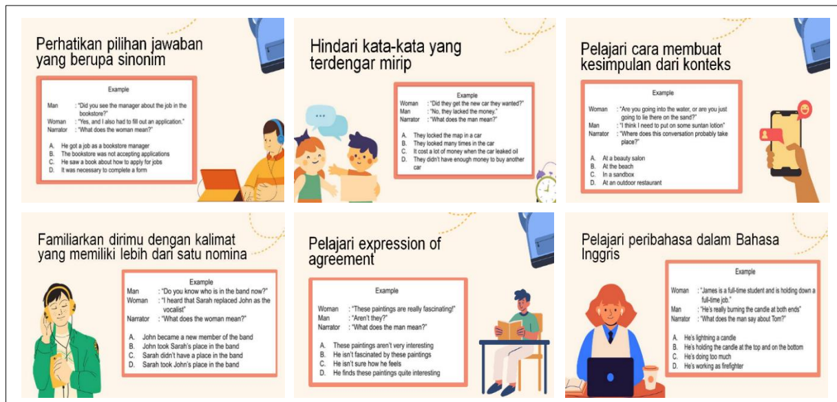
Gambar 2. Materi dari Tips dan Trik pada TOEFL Listening

Gambar 2 menampilkan rangkuman materi mengenai tips dan trik dalam menghadapi TOEFL listening yang diberikan kepada mahasiswa pada sesi pelatihan. Materi ini bertujuan untuk membantu mahasiswa memahami pola-pola umum dalam soal listening serta meningkatkan strategi pemecahan masalah saat mendengarkan audio. Dalam gambar tersebut ditunjukkan beberapa strategi penting, seperti mengenali sinonim pada pilihan jawaban, menghindari kata-kata yang terdengar mirip, serta membuat kesimpulan berdasarkan konteks percakapan sebagai dasar peningkatan kompetensi listening mahasiswa.