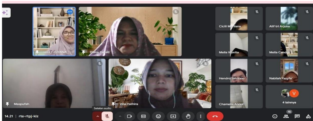
Gambar 3. Narasumber Menjelaskan Tips dan Trik TOEFL Listening kepada Mahasiswa

Gambar 2 menampilkan rangkuman materi mengenai tips dan trik dalam menghadapi TOEFL listening yang diberikan kepada mahasiswa pada sesi pelatihan. Materi ini bertujuan untuk membantu mahasiswa memahami pola-pola umum dalam soal listening serta meningkatkan strategi pemecahan masalah saat mendengarkan audio. Dalam gambar tersebut ditunjukkan beberapa strategi penting, seperti mengenali sinonim pada pilihan jawaban, menghindari kata-kata yang terdengar mirip, serta membuat kesimpulan berdasarkan konteks percakapan sebagai dasar peningkatan kompetensi listening mahasiswa.