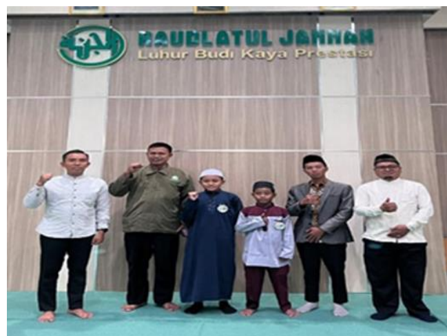
Gambar 4. Siswa Pemenang lomba & Dewan Juri