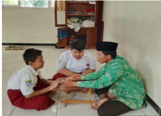
Gambar 2. Pendampingan & Pelatihan Siswa

kekurangan program (Akmal, et.al. 2024), sehingga dapat diketahui hal-hal yang perlu perbaikan & peningkatan. Hasil refleksi menunjukkan peningkatan kemampuan teknis adzan dan kepercayaan diri siswa. Adapun tindak lanjut kegiatan, dewan juri merekomendasikan kegiatan ini diarahkan pada pembentukan ekstrakurikuler muadzin cilik di sekolah dasar sebagai tindak lanjut keberlanjutan program.