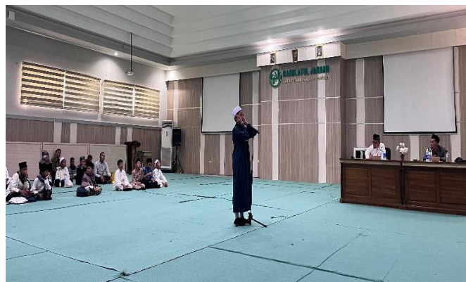
Gambar 3. Penjurian lomba adzan