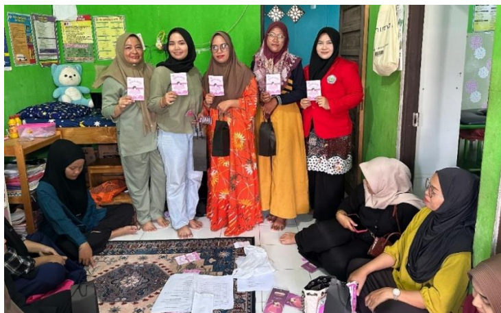
Gambar 6. Penerimaan Dorprise Wanita Usia Subur (WUS)

Selain itu, penelitian global (WHO, 2022) menegaskan bahwa promosi kesehatan yang dilakukan secara rutin dan menggunakan pendekatan komunitas dapat meningkatkan cakupan deteksi dini hingga 40% di wilayah dengan angka partisipasi rendah. Hal ini menunjukkan pentingnya keberlanjutan program CANTIK JELITA dalam meningkatkan kesehatan reproduksi masyarakat.