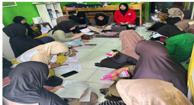
Gambar 3. Pelaksanaan Post-Test