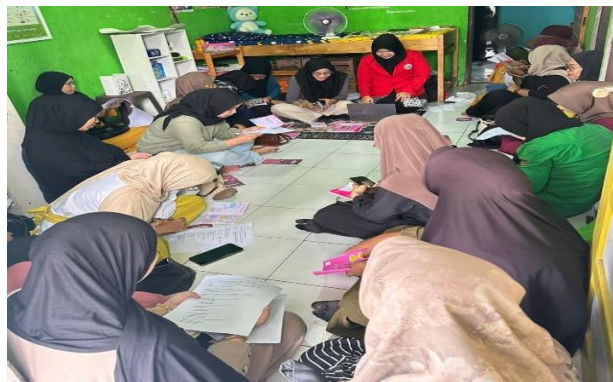
Gambar 1. Pelaksanaan Pre-Test

Berdasarkan hasil evaluasi, sebagian besar peserta mengalami peningkatan kategori pengetahuan dari nilai awal (pre-test) ke nilai setelah edukasi (post-test). Hal ini menunjukkan bahwa program edukasi "CANTIK JELITA" berhasil meningkatkan pemahaman peserta mengenai kanker serviks dan pentingnya pemeriksaan IVA. Evaluasi juga memperlihatkan bahwa kegiatan edukasi yang interaktif dan disertai media visual mampu membantu peserta memahami materi dengan lebih mudah dan mendorong mereka untuk lebih peduli terhadap kesehatan reproduksi.