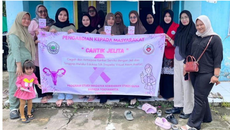
Gambar 4. Dokumentasi Wanita Usia Subur (WUS)