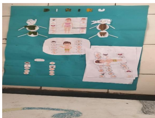
Gambar 3. Media gambar anggota tubuh

Kemudian anak-anak diberikan media pembelajaran berupa poster tentang anggota tubuh dan diberikan penjelasan tentang bagian tubuh mana yang boleh disentuh dan tidak. Menurut (Tampubolon et al., 2023) bahwa Kurikulum Pendidikan seksual anak pada tingkatan Taman Kanak-Kanak meliputi : (1) melanjutkan perkembangan konsep memahami diri dan identitas seksual; (2) mulai mengembangkan perasaan kasih sayang; (3) menguatkan tentang perbedaan jenis kelamin antara laki-laki dan perempuan; (4) mulai menguatkan kembali peran keluarga dalam kehidupannya; (5) memahami adanya kehidupan dalam tubuh ibunya; (6) memahami keingintahuan terhadap badan dan fungsinya; dan (7) mulai mengembangkan bahasa yang tepat tentang bagian-bagian tubuh serta fungsinya. Setelah itu, untuk menguji pemahaman anak, mereka diberikan kegiatan mengidentifikasi dan menempel bagian-bagian tubuh.