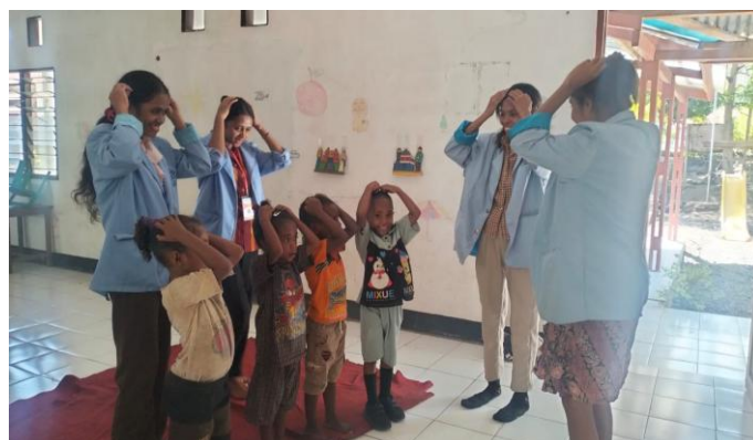
Gambar 2. Menyebutkan anggota tubuh

Anak-anak masih kebingungan untuk menjawab bagian yang boleh dan tidak boleh disentuh. Secara umum, semua bagian tubuh yang tampak dari luar disebutkan anak-anak boleh untuk disentuh. Namun, mereka masih bingung untuk menjawab bagian mana yang tidak boleh disentuh. Anak-anak menjawab bagian tubuh yang tampak dari luar juga tidak boleh untuk disentuh.