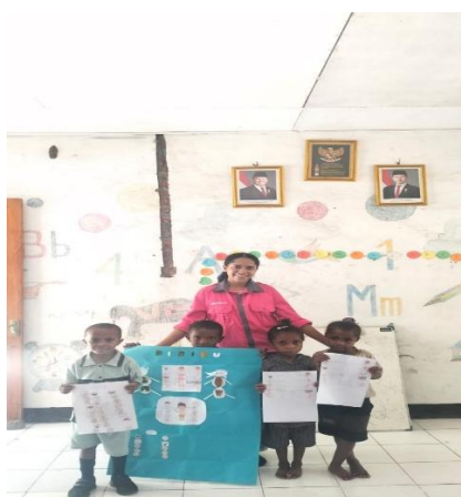
Gambar 5. Foto bersama anak dan hasil kerjanya

Diakhir dari kegiatan, ada pertanyaan yang diberikan terkait dengan kegiatan pembelajaran yang telah dilakukan, kemudian dilanjutkan dengan foto bersama anak-anak.