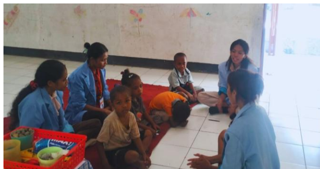
Gambar 1. Memberikan pertanyaan pemantik terkait anggota tubuh