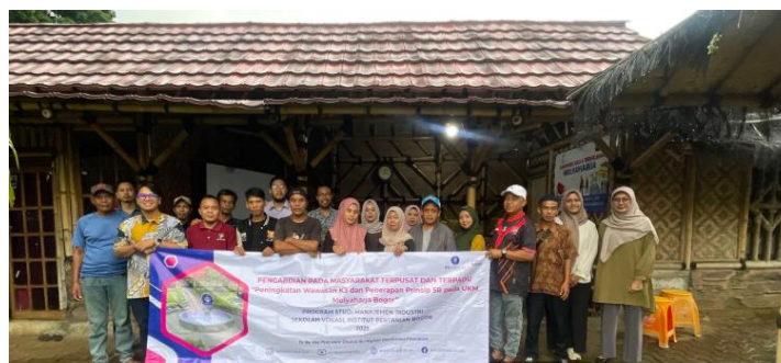
Gambar 3. Kegiatan Evaluasi Pelatihan

Pada tahap akhir kegiatan pengabdian kepada masyarakat ini dilakukan evaluasi dengan membagikan post-test kepada para karyawan. Hasil post-test dapat digunakan sebagai indikator dalam pemahaman peserta pelatihan terhadap materi pelatihan implementasi 5R sehingga dapat meningkatkan kesadaran karyawan akan budaya kerja 5R. Kegiatan post-test dapat dilihat pada gambar 3.