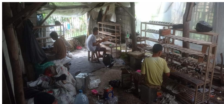
Gambar 1. Identifikasi Kesadaran 5R

Ketiga tahapan pada pengabdian kepada masyarakat ini bertujuan untuk memberikan edukasi terkait budaya implementasi 5R pada lingkungan kerja terhadap peningkatan kinerja karyawan, meningkatkan keselamatan kerja, dan membangun budaya kerja yang lebih kuat. Kegiatan identifikasi kebutuhan ini dilakukan untuk observasi area kerja dan memahami kendala utama dalam menjaga keteraturan ruang kerja, efisiensi proses, serta kendala budaya kerja terkait penerapan prinsip 5R. Kegiatan identifikasi kebutuhan pengabdian kepada masyarakat dapat dilihat pada gambar 1.