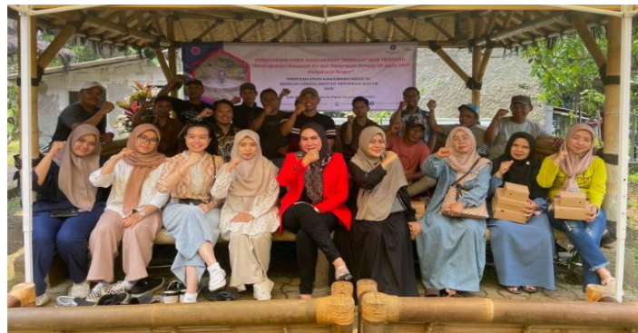
Gambar 2. Kegiatan Pelatihan Implementasi 5R

Setelah mendapatkan hasil pre-test pada tahap identifikasi, selanjutnya dilakukan pelatihan implementasi 5R pada lingkungan kerja untuk meningkatkan kesadaran karyawan akan kondisi lingkungan kerja. Pada tahap ini peserta yang dijadikan sample pada tahap identifikasi diundang untuk dapat melakukan praktik langsung bagaimana mengimplementasikan budaya kerja 5R dan dilakukan diskusi tanya jawab untuk memberi kesempatan peserta pelatihan dalam meningkatkan pengetahuan dan pemahamannya. Kegiatan pemberian materi budaya kerja 5R dan simulasi praktik implementasi 5R pada kegiatan Pengabdian Masyarakat dapat dilihat pada gambar 2.