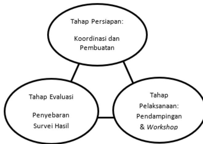
Gambar 1. Tahapan Pelaksanaan Program Pengabdian Masyarakat

Program pengabdian dilaksanakan melalui pendampingan dan workshop dengan cakupan materi pada pengenalan dasar, pencatatan, dan laporan keuangan sederhana yang disesuaikan dengan kebutuhan lapangan melalui pembuatan modul edukasi. Pendampingan juga dilakukan dengan memberikan studi kasus atau simulasi pencatatan yang dapat meningkatkan pemahaman kelompok. Setelah itu, tim pengabdian membuat survei untuk evaluasi hasil pengabdian yang disebarikan pada kelompok sehingga dapat mengukur sejauh mana program pengabdian berguna dan bermanfaat bagi kelompok. Tahap evaluasi bertujuan untuk mengukur tingkat efektifitas dan efisiensi materi yang telah diberikan. Evaluasi ini dilakukan dengan melakukan penyebaran survei kepuasan kepada anggota kelompok yang menjadi peserta di dalam program pengabdian kepada masyarakat ini.