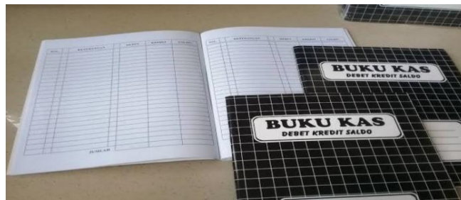
Gambar 3. Buku Kas

Selain itu, agar mempermudah pemahaman peserta dalam melakukan entri jurnal, tim pengabdian memberikan buku kas yang dapat dijadikan sebagai sarana dalam mencatat pengeluaran dan pemasukan dari kelompok tani.