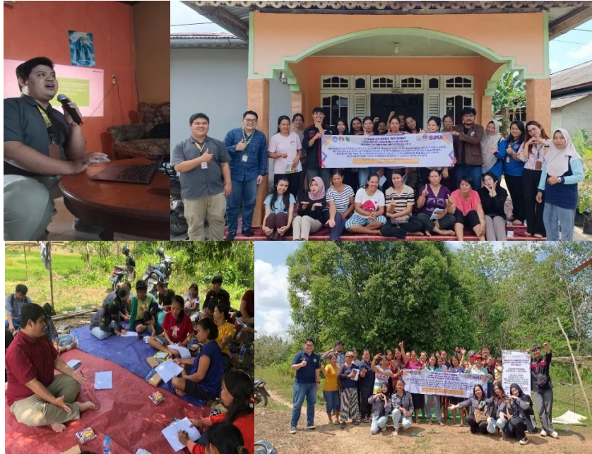
Gambar 6. Pemaparan Materi dan Pendampingan Kelompok Tomat Intan dan Kelompok Karya Tani

Pada tahap ini dilakukan pemaparan materi berdasarkan modul yang telah dibuat sebelumnya. Pemaparan modul diawali dengan memberikan modul yang telah diringkas pada pamflet, kemudian tim mulai menjelaskan materi-materi meliputi pengertian dasar akuntansi, persamaannya, pengenalan single entry jurnal hingga pada pelaporan keuangan.