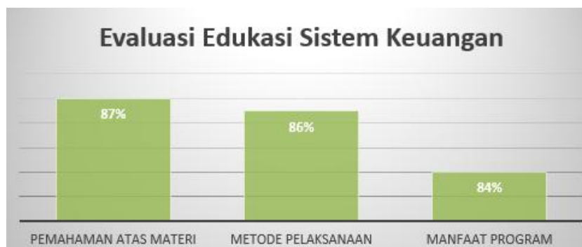
Gambar 7. Hasil Evaluasi Program Pengabdian Masyarakat

Setelah memberikan materi dan simulasi berupa studi kasus, tim pengabdian juga memberikan kuesioner evaluasi agar mengetahui kekurangan dalam program pengabdian yang dilakukan. Evaluasi yang diberikan difokuskan pada pemahaman materi yang diberikan oleh tim, manfaat dari program yang diberikan oleh tim, dan metode pelaksanaan yang digunakan oleh tim pengabdian dengan harapan, program pengabdian ke depan dapat sesuai dengan kebutuhan lapangan.