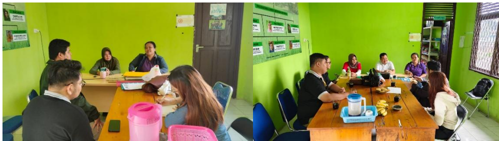
Gambar 4. Izin dan Koordinasi Jadwal kegiatan Pemberian Edukasi

Kegiatan pengabdian dilakukan dengan meminta izin dan koordinasi Balai Penyuluh Pertanian Kecamatan Bengkayang. Berdasarkan hasil wawancara dan observasi yang dilakukan, mitra menyarankan memberikan edukasi pada 2 kelompok wanita tani. Kegiatan pengabdian ini dilaksanakan agar dapat membantu mitra dalam memberikan edukasi terkait pengelolaan dan penyusunan keuangan.