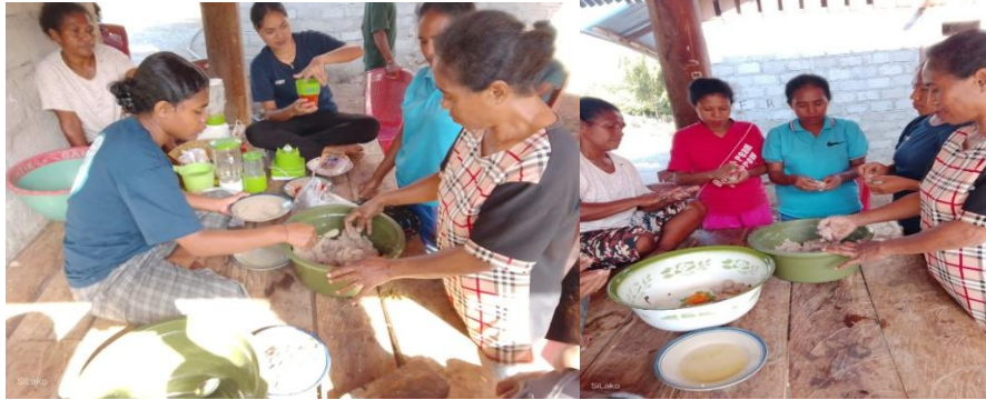
Gambar 1. Pelatihan Pembuatan Bakso

Pada tahap perebusan, peserta belajar tentang pentingnya pengendalian suhu air dan waktu pemasakan agar bakso matang sempurna dengan tekstur yang kenyal. Keseluruhan praktik dilakukan secara partisipatif, sehingga setiap peserta berkesempatan mencoba langsung keterampilan yang diperoleh. Hasilnya, semua peserta berhasil menghasilkan bakso ikan terbang dengan rasa khas laut yang gurih dan tekstur yang sesuai standar.