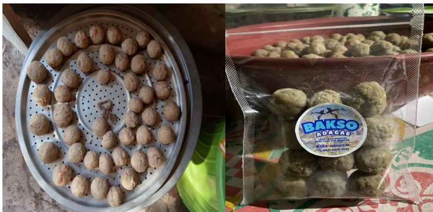
Gambar 2. Hasil Produk Bakso Ikan Terbang Siap Saji

Secara keseluruhan, kegiatan ini memberikan dampak positif baik dalam peningkatan pengetahuan maupun keterampilan teknis peserta. Peserta tidak hanya memahami nilai gizi dan potensi ekonomi dari ikan terbang, tetapi juga memperoleh pengalaman praktis yang aplikatif. Lebih jauh, kegiatan ini menjadi langkah awal dalam membangun kesadaran kolektif masyarakat pesisir mengenai pentingnya inovasi pengolahan pangan berbasis potensi lokal sebagai strategi pemberdayaan ekonomi keluarga.