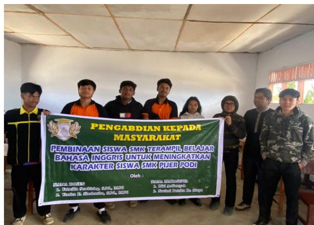
Gambar 2. Pelaksanaan Pengabdian di SMK Pijer Prodi