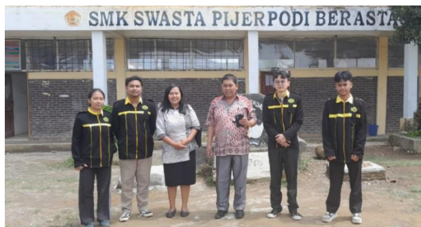
Gambar 1. Observasi dengan Kepala Sekolah