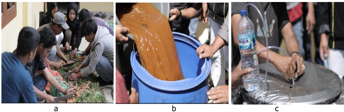
Gambar 4. Penerapan dan produksi (a.pengecilan ukuran, b.pencampuran bahan, c.proses fermentasi)

Pelaksanaan kegiatan pengabdian kepada masyarakat dengan fokus kepada manajemen limbah wortel telah menghasilkan perubahan signifikan dalam pemanfaatan limbah wortel. Selama proses pendampingan berlangsung kegiatan ini telah memproduksi POC berbasis limbah wortel. Petani didampingi dalam penerapan teori pembuatan dan produksi. Rangkain pembuatan POC mulai dari persiapan bahan, proses pengecilan ukuran bahan, pencampuran bahan, sampai pada proses fermentasi serta pada pengemasan produk.