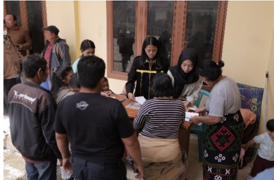
Gambar 3. kegiatan pelatihan dan transfer teknologi (post-test dan pre-test)

Hasil ini menunjukkan bahwa pelatihan dan transfer teknologi memberikan pengetahuan yang baru bagi anggota kelompok tani. Pemahaman petani akan manfaat POC meningkat sebesar 52% dimana pemakaian POC yang secara terus menerus akan memperbaiki kondisi tanah dan akan meningkatkan pertumbuhan mikroorganisme seperti jamur dan bakteri yang akan meningkatkan kesuburan tanah. Pemahaman akan teknik fermentasi juga meningkat sebesar 59%. Dalam pengolahan limbah wortel petani memahami perbedaan teknik fermentasi aerob dan anaerob berikut dengan bahan yang digunakan serta mikroorganisme yang dipakai untuk proses dekomposisi wortel menjadi POC. Penjelasan yang diberikan mengenai potensi nilai jual POC juga meningkatkan pemahaman petani sebesar 57%. Petani memahami disamping digunakan sebagai substitusi pupuk kimia yang selama ini digunakan, produksi limbah wortel menjadi POC dapat dijual untuk meningkatkan pendapatan petani. Kegiatan pelatihan dan transfer teknologi ditampilkan pada gambar 3 berikut ini.