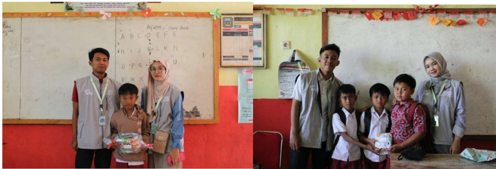
Gambar 5. Pemberian reward kepada siswa

Pada setiap pembelajaran tertentu dan permainan yang dilaksanakan, kepada siswa yang berhasil akan mendapatkan hadiah berupa snack atau point bintang. Pendekatan dengan metode ini ternyata dapat memotivasi siswa untuk lebih berpartisipasi aktif dan berani tampil ke depan kelas. Sebagian siswa menunjukkan peningkatan dalam hal keberanian berbicara, meskipun masih ada beberapa siswa yang masih ragu untuk maju. Reward merupakan perlakuan yang menyenangkan sebagai salah satu faktor psikologi belajar, juga merupakan bentuk contoh nyata motivasi ekstrinsik yang diberikan guru untuk menolong siswa belajar. Pemberian reward dalam aktivitas belajar di kelas bertujuan untuk menciptakan suasana menyenangkan dalam belajar bagi siswa, juga mendorong semangat dan motivasi belajar siswa (Febianti, 2018).