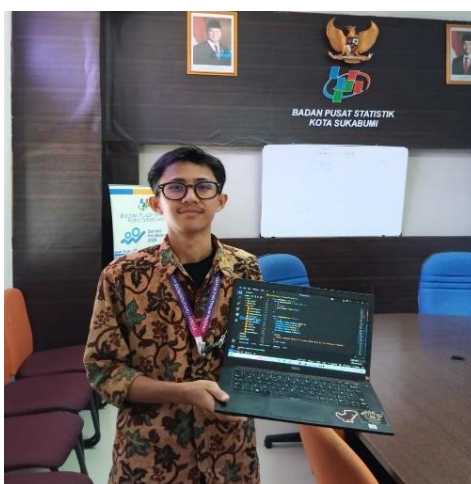
Gambar 4. Dokumentasi Kegiatan

Implementasi sistem backend ini secara langsung menjawab tantangan operasional di BPS Kota Sukabumi. Proses pencarian data menjadi instan, dan rekapitulasi laporan dapat dihasilkan secara digital, menghemat waktu dan sumber daya secara signifikan. Namun, kontribusi yang lebih mendalam terletak pada kemampuannya untuk mendukung pengambilan keputusan berbasis data. Data timestamp yang terkumpul secara otomatis memungkinkan manajemen untuk menganalisis Key Performance Indicators (KPI) efisiensi layanan seperti waktu tunggu rata-rata (selisih Jam_diterima dan Jam_Submit_data ) dan waktu layanan rata-rata (selisih jam_selesai_tindak_lanjut dan jam_diterima ). Analisis ini dapat mengidentifikasi potensi hambatan dalam alur pelayanan dan menjadi dasar untuk perbaikan proses yang terukur. Dengan demikian, buku tamu bertransformasi dari alat administratif menjadi instrumen strategis untuk optimasi layanan, sejalan dengan semangat e-government untuk meningkatkan efisiensi dan akuntabilitas pelayanan publik (Andry & Sawir, 2024).