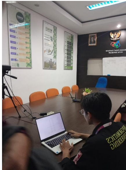
Gambar 4. Dokumentasi Kegiatan Magang

Pada gambar 3 tersebut dimana admin mengelola data tamu yang sudah mengisi data tamu dan menindak lanjuti tujuan dari kunjungan tamu.