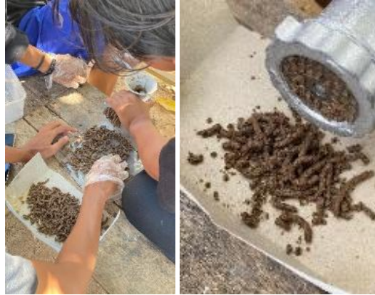
Gambar 4. Bentuk Pakan yang Berhasil Dicetak