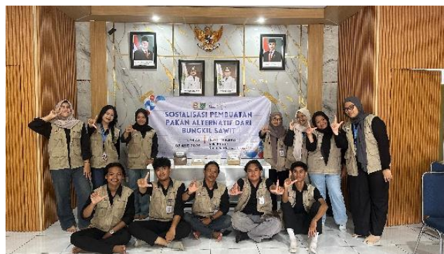
Gambar 2. Pelaksanaan Kegiatan Sosialisasi

Tahapan sosialisasi pembuatan pakan alternatif berbahan bungkil sawit untuk budidaya ikan bandeng dimulai dengan persiapan materi dan alat bantu untuk mendukung kegiatan pelatihan. Selanjutnya, dilakukan penyuluhan kepada kelompok pembudidaya mengenai pentingnya penggunaan pakan alternatif, keunggulan bungkil sawit, serta manfaatnya dalam meningkatkan efisiensi produksi dan menjaga keberlanjutan lingkungan. Kemudian, dilanjutkan dengan pengenalan alat dan bahan yang akan digunakan dalam proses pembuatan pakan, penjelasan mengenai proses pencampuran bahan, pembentukan pakan hingga proses pengeringan. Sesi diskusi dan tanya jawab juga digelar untuk memastikan peserta memahami tahapan dan siap menerapkan teknik tersebut secara mandiri. Sebagai tindak lanjut, pendampingan dan monitoring dilakukan secara berkala untuk mendukung keberhasilan implementasi pakan alternatif dan meningkatkan hasil budidaya ikan bandeng.