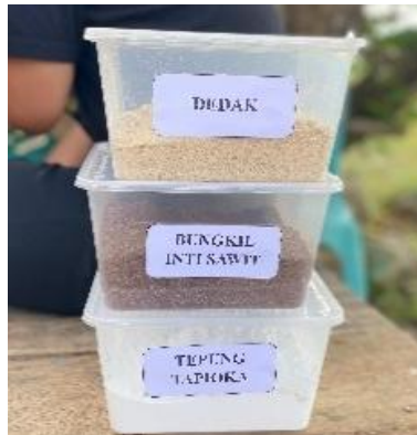
Gambar 3. Bahan Pembuatan Berbasis Pakan Bungkil Sawit

Tahap awal dalam pembuatan pakan alternatif dari bungkil sawit adalah persiapan alat dan bahan. Alat yang digunakan untuk pembuatan pakan alternatif dari bungkil sawit berdasarkan materi sosialisasi yang disampaikan yaitu ember, mesin penggiling atau pencetak pakan, timbangan, dan penyimpanan berupa karung. Kemudian, bahan yang digunakan untuk pembuatan pakan dari bungkil sawit berdasarkan materi sosialisasi yang disampaikan yaitu bungkil inti sawit, dedak halus, tepung ikan, tepung tapioka, dan air secukupnya. Langkah pertama dalam merancang formula pakan adalah pemilihan bahan baku yang akan digunakan. Pakan ikan atau yang sering disebut sebagai pelet ikan, yang berkualitas harus memiliki kandungan nutrisi yang mencukupi, seperti protein, lemak, karbohidrat, vitamin, mineral, dan energi, untuk mendukung pertumbuhan ikan dengan baik. Kualitas pelet ikan sangat tergantung pada bahan baku yang digunakan (Permadi et al., 2024). Peralatan yang digunakan untuk membuat pakan mandiri secara sederhana, praktis dan mudah diantaranya adalah dengan menggunakan mesin pakan yang berguna untuk menghaluskan bahan baku pembuatan pakan, baskom plastik yang berguna untuk menampung hasil dari penggilingan pakan, sendok makan yang berguna untuk mengaduk bahan pembuatan pakan (Purnamasari et al., 2022). Hal ini merupakan salah satu pemberdayaan yang menguntungkan bagi para pelaku Petambak karena dengan ketersediaan alat dan bahan (Ansar et al., 2022).