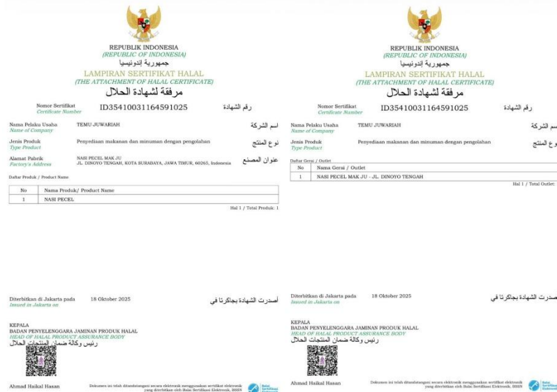
Gambar 4. Lampiran Sertifikat Halal UMKM Nasi Pecel Mak Ju

Pendampingan sertifikasi halal merupakan tahapan penting yang dilakukan dengan metode praktik langsung ( hands-on guidance ) kepada pelaku UMKM. Tahap ini bertujuan menjembatani kesenjangan digital dan prosedur yang sering dihadapi oleh pelaku usaha. Untuk memulai pendampingan sertifikasi halal, terlebih dahulu harus mengajukan Nomor Induk Berusaha (NIB). Pendampingan sertifikasi halal harus diawali dengan pengajuan Nomor Induk Berusaha (NIB). NIB berfungsi sebagai identitas resmi yang mengidentifikasi pelaku usaha berdasarkan bidang kegiatannya. Para pelaku bisnis wajib memiliki NIB jika ingin mengurus perizinan usaha melalui sistem Online Single Submission (OSS). Dengan demikian, NIB merupakan persyaratan legal utama yang menunjukkan kesiapan UMKM. Sistem OSS sendiri dirancang sebagai platform perizinan berbasis teknologi informasi yang mengintegrasikan seluruh izin dari pemerintah pusat maupun daerah, bertujuan untuk mempermudah kegiatan bisnis di dalam negeri. (Murdiana, Kristanti, Mustofa 2022). Penerapan sistem jaminan produk halal pada UMKM melalui platform digital seperti SiHalal memerlukan pendampingan intensif untuk mendorong perekonomian negara (Munawar, Rohmah, and Rahmadi 2023).