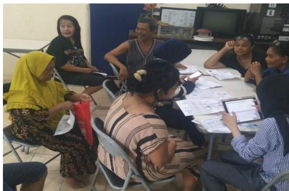
Gambar 2. Proses Pengumpulan dan Verifikasi Dokumen Persyaratan Sertifikasi Halal