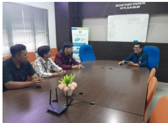
Gambar 5. Dokumentasi Kegiatan Magang